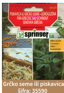
Grčko seme ili piskavica šifra: 35590