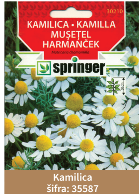
Kamilica šifra: 35587