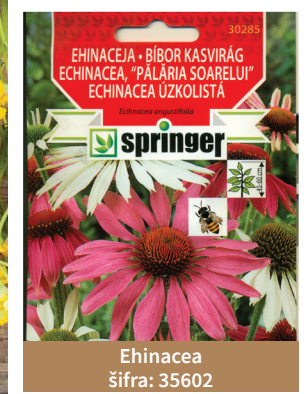
Ehinacea šifra: 35602