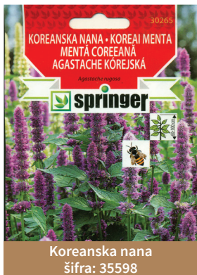
Koreanska nana šifra: 35598