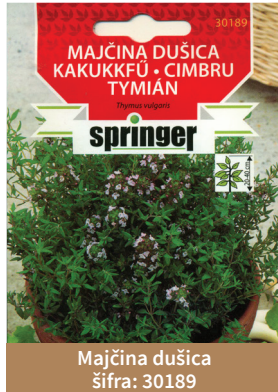
Majčina dušica šifra: 30189