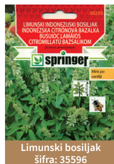
Limunski bosiljak šifra: 35596

Mirođija i žalfija svojim mirisom odbijaju kupusne sovce tako da je korisno uzgajati ih pored kupusnjača (kopus, karfiol, kelj, brokoli).