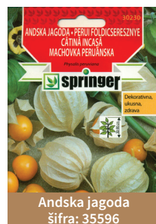
Andska jagoda šifra: 35596