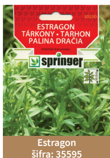
Estragon šifra: 35595

Andska jagoda ili fizalis ima male narandžaste plodove slatkastog ukusa i koristi se u svežem stanju kao prilog raznim jelima.