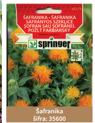
Šafranika šifra: 35600