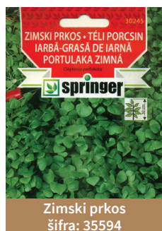
Zimski prkos šifra: 35594