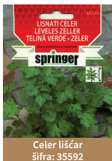
Celer lišćar šifra: 35592