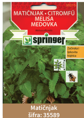
Matičnjak šifra: 35589

Limunova trava služi kao poboljšivač ukusa poznatih mešavina čajeva jer daje svež ukus limuna. U indijskoj kuhinji u mlevenom stanju služi kao začim za jela.