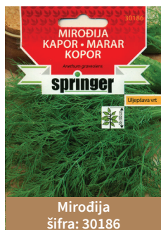
Mirođija šifra: 30186