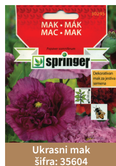
Ukrasni mak šifra: 35604