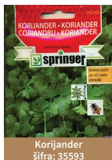
Korijander šifra: 35593