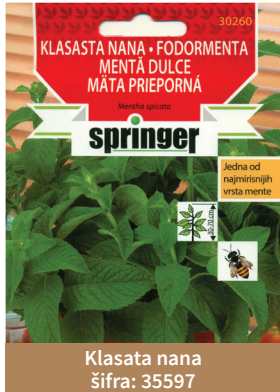
Klasata nana šifra: 35597