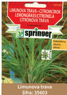
Limunova trava šifra: 35603