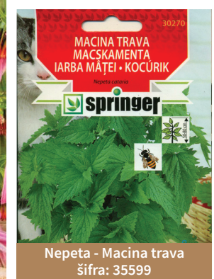
Nepeta - Macina trava šifra: 35599

Spilantes se koristi za lečenje zubobolje i za dezinfekciju usne duplje. Koristi se cvet i list u svežem stanju.