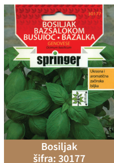
Bosiljak šifra: 30177