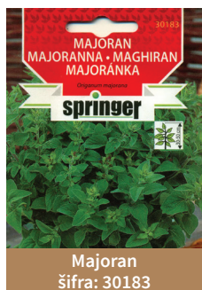
Majoran šifra: 30183