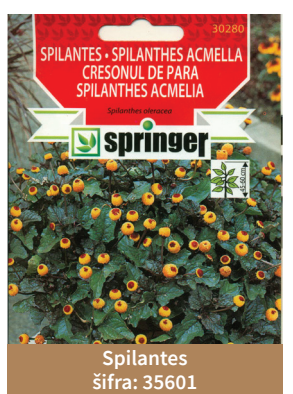
Spilantes šifra: 35601